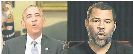
喜劇演員皮爾靠著影像後制軟體, 將自己的嘴型合成到奧巴馬臉上, 几可亂真的影片在網路上爆紅。